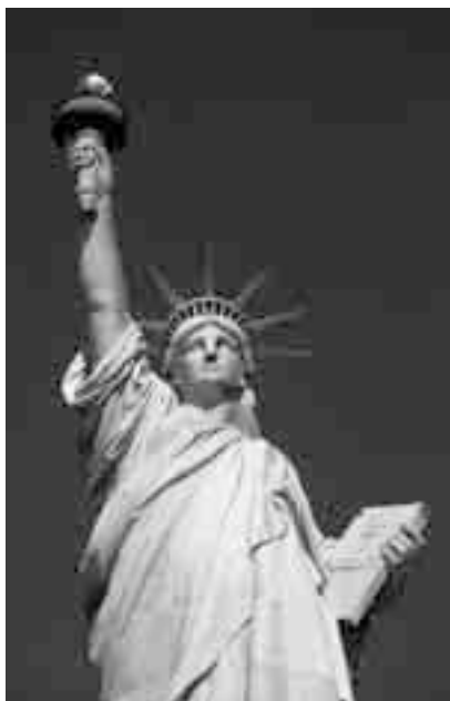
Vrijheidsbeeld New York VS.

Not like the brazen giant of Greek fame, with conquering limbs astride from land to land; Here at our sea-washed, sunset gates shall stand a mighty woman with a torch, whose flame is the imprisoned lightning, and her name Mother of Exiles. From her beacon-hand Glow world-wide welcome; her mild eyes command The air-bridged harbor that twin cities frame, "Keep, ancient lands, your storied pomp!" cries she with silent lips. "Give me your tired, your poor, Your huddled masses yearning to breathe free, The wretched refuse of your teeming shore, Send these, the homeless, tempest-tost to me, I lift my lamp beside the golden door!"