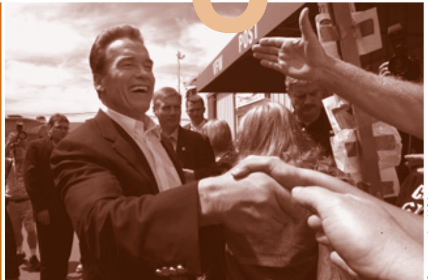
Gouverneur Arnold Schwarzenegger.