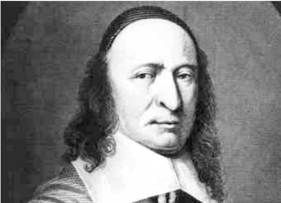
Peter Stuyvesant.