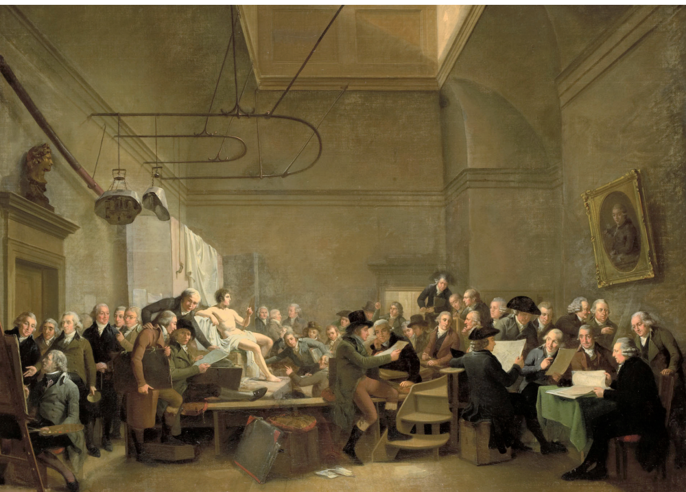
Adriaan de Lelie (1801), De tekenzaal van de Maatschappij Felix Meritis

De tabel laat ook zien dat de vrouwelijke beeldend kunstenaars op hun twintigste over het algemeen een hogere levensverwachting hadden dan hun mannelijke generatiegenoten. Dat past in het algemene beeld dat we van de verschillen in levensduur tussen mannen en vrouwen in andere landen hebben. Er zijn trouwens pas voldoende vrouwelijke kunstenaars om mee te kunnen rekenen vanaf de periode 1750-99. Beeldhouwers hadden veelal een hogere levensverwachting dan schilders. Er zou sprake kunnen zijn van zelfselectie: beeldhouwen wordt verkozen door wat sterkere mannen en vrouwen die graag buiten werken en flink moeten hakken en ze hebben bovendien geen last van chemicaliën waarmee schilders in aanraking kwamen. Maar wat het zwaarste weegt blijft onbekend.