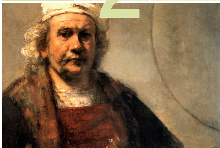
Rembrandt van Rijn (1669), Zelfportret met twee cirkels