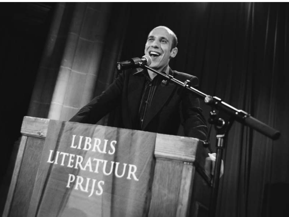
De schrijver Abdelkader Benali won in 2003 de Libris Literatuur Prijs.