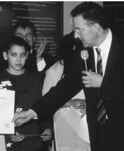
Wethouder Aboutaleb van Amsterdam.