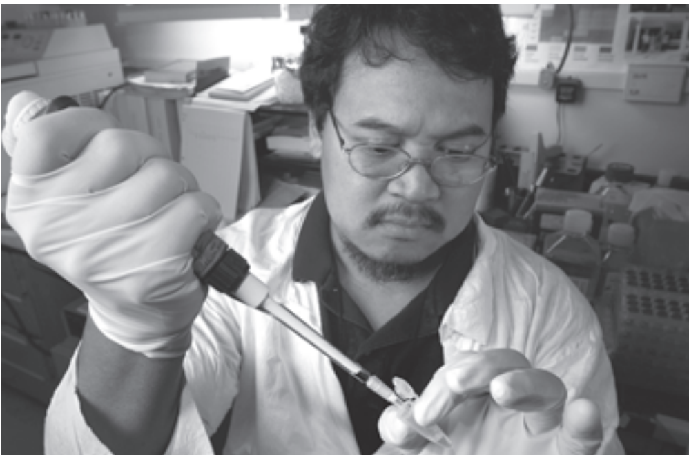
Onderzoek naar SARS