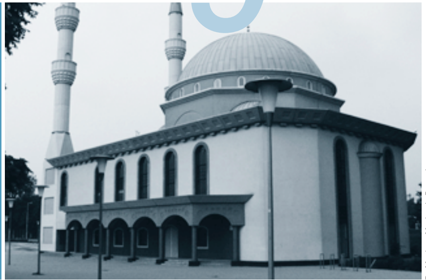
De Mevlana Moskee in Rotterdam.