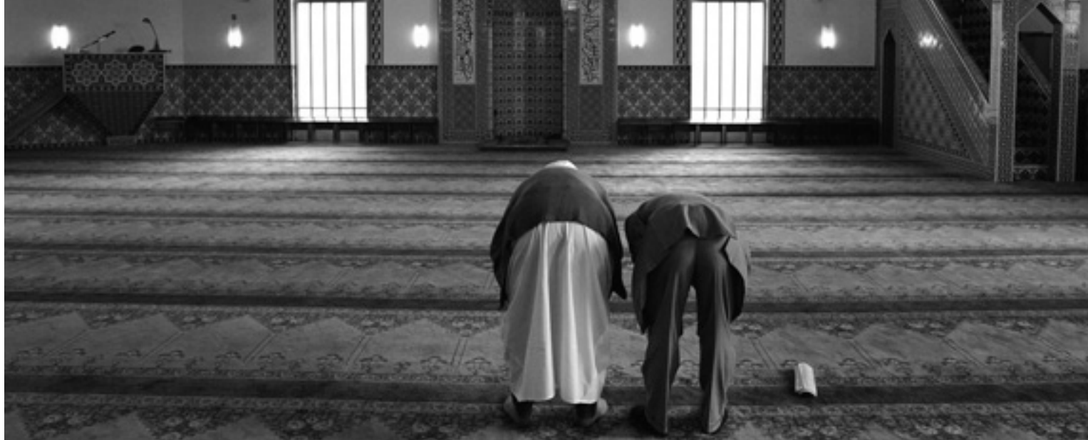
Bidders in de Mevlana Moskee in Rotterdam.