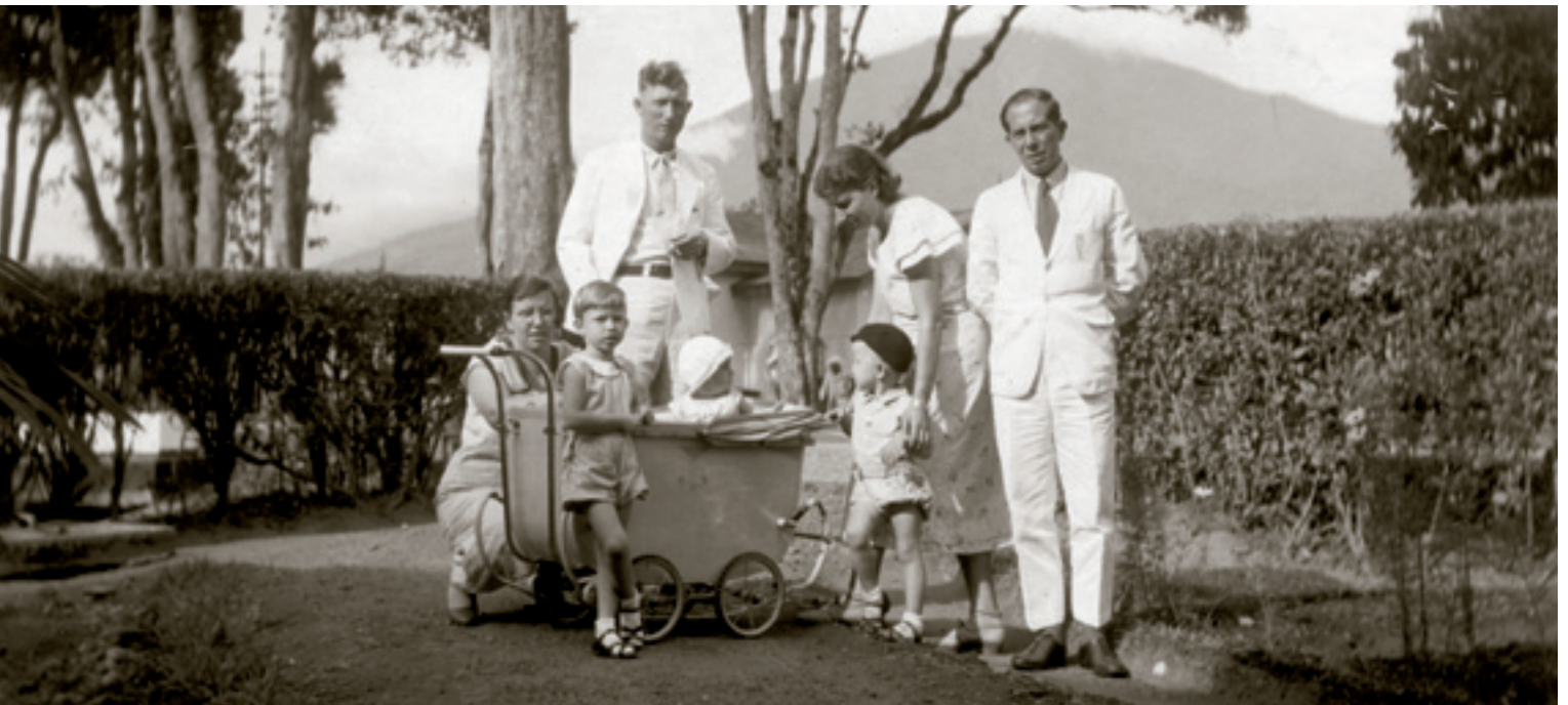
Twee Nederlandse echtparen in Nederlands-Indië met hun kinderen. 1935-1940.

Eeuwenlang was Nederland een koloniale mogendheid. Vanaf de vroege 17 e eeuw vertrokken Nederlanders naar de koloniën in Afrika, de Amerika's en Azië. Andersom arriveerden inwoners uit die koloniën in het 'moederland'. Het ging om kleine aantallen; in de koloniale tijd, vooral in de 20 ste eeuw, werd alleen het Nederlands-Indische migratiecircuit uiteindelijk getalsmatig betekenisvol. De naoorlogse dekolonisaties veroorzaakten immigratie naar Nederland op veel grotere schaal; daartegenover stond slechts geringe emigratie of retourmigratie naar de voormalige kolonie. Hoe heeft de migratie tussen Indonesië en Nederlands-Indië zich in de afgelopen eeuw ontwikkeld; wat waren de achtergronden en wie migreerden er?