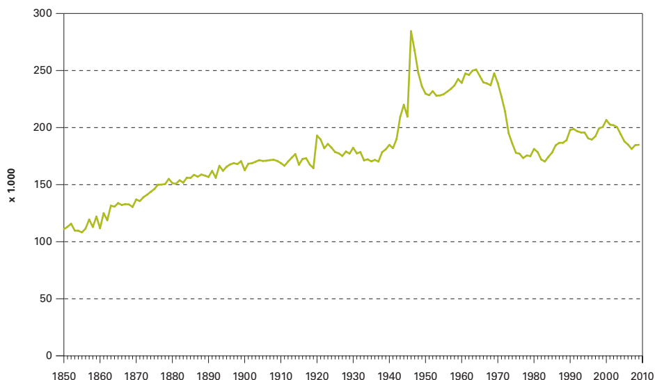
Figuur 1. Aantal levendgeborenen, Nederland, 1850-heden

In 2011 worden de mensen die de geboortepiek vormden 65 jaar, maar hoeveel van degenen die 65 jaar geleden in Nederland werden geboren bereiken dit jaar de leeftijd van 65 jaar? Het antwoord op die vraag weten we niet helemaal precies. Er zijn immers mensen die nu wel in ons land wonen en dit jaar de leeftijd van 65 jaar bereiken, maar die niet in Nederland werden geboren. Bovendien zijn er in Nederland geboren die ons