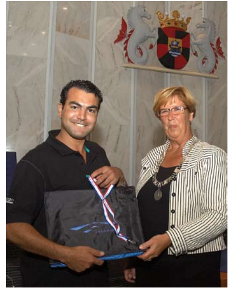
Allochtonen die Nederlander willen worden, moeten verplicht een speciale ceremonie bijwonen en een zogenoemde ‘verklaring van gebondenheid’ afleggen

Bij dit cultuurconflict gaat het vaak om de tegenstelling tussen westerse ideeën en traditioneel islamitische standpunten. Dat ligt ook in de rede, want moslims vormen met ongeveer 850 duizend aanhangers de helft van de niet-westerse allochtonen. Bovendien is de islam mondiaal gezien een zeer belangrijke religie waarin sterke anti-westerse stromingen bestaan die ook de moslims in Nederland niet onberoerd laten. Het overgrote