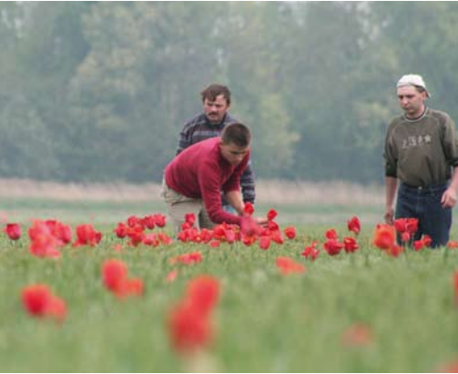
Veel gastarbeiders werken in de tuinbouw

Toen in de jaren negentig al deze stromen langzaam opdroogden, kwam er een nieuwe immigratie op gang. Asielzoekers uit een groot aantal landen in Azië en Afrika zochten om redenen van persoonlijke veiligheid en economische vooruitzichten, toegang tot Europa. Nederland was met zijn betrekkelijk ruimhartige asielbeleid toen een populair vestigingsland. In de jaren negentig kreeg ons land per duizend inwoners ruim twee keer zoveel asielverzoeken te verwerken als de toenmalige Europese Unie in haar geheel. Daarnaast kregen de Turkse en Marokkaanse immigratie een nieuwe impuls. Want hier geboren of opgegroeide jongeren trouwden met een partner in het land van herkomst en lieten die vervolgens naar Nederland komen.